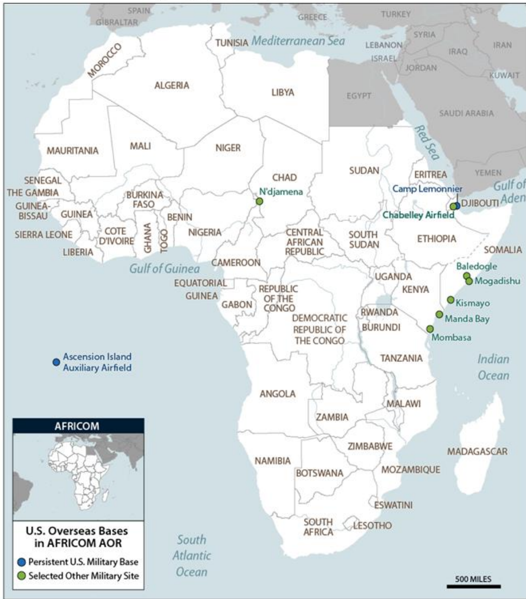
Figure 5. U.S. Overseas Bases in Africa