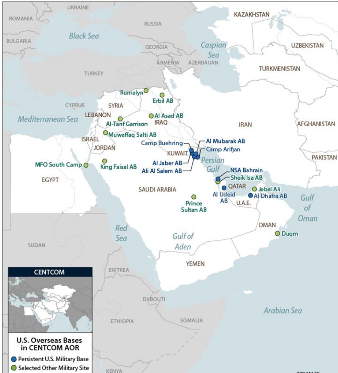
Figure 4. U.S. Overseas Bases in the Middle East