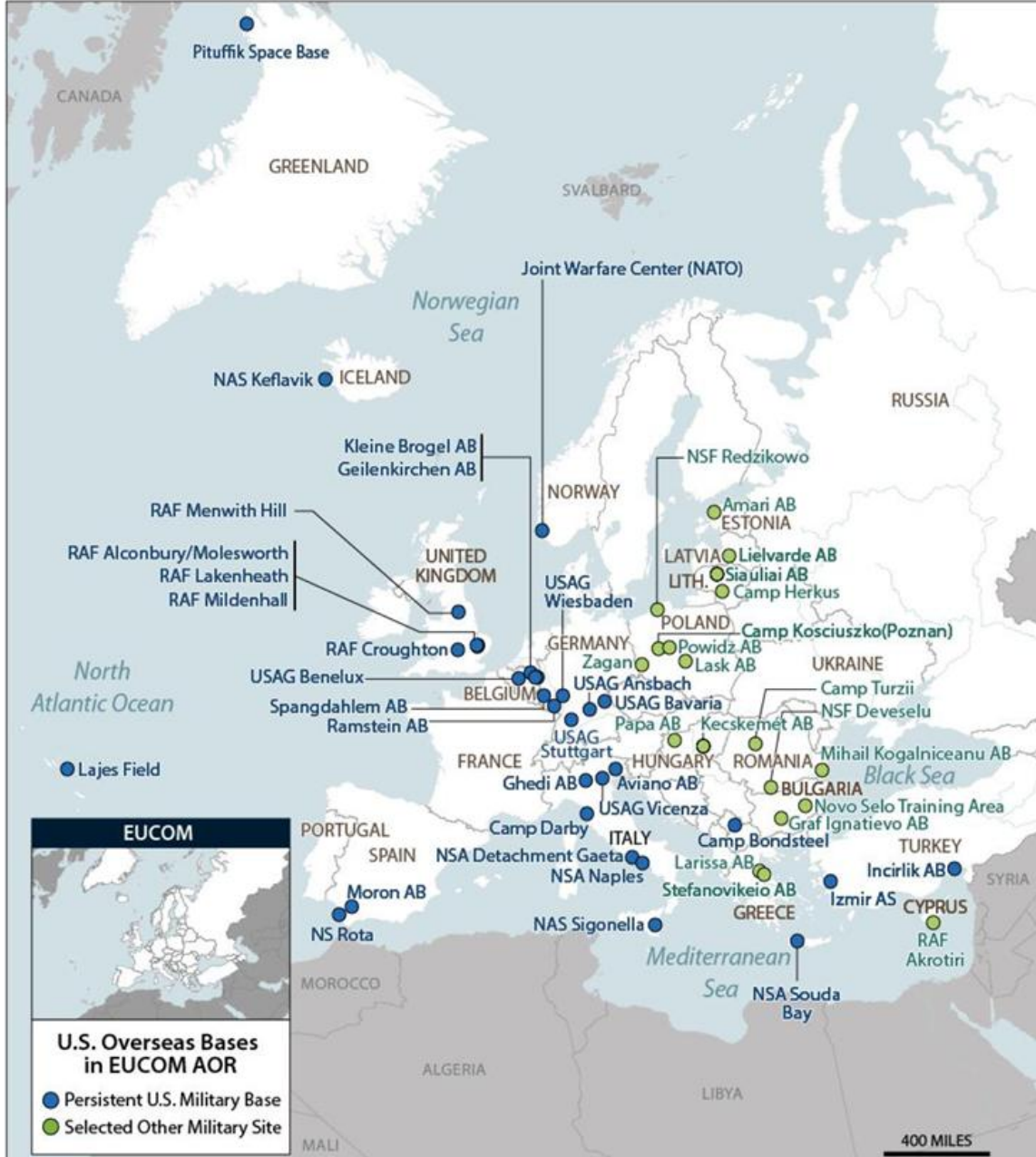
Figure 3. U.S. Overseas Bases in Europe