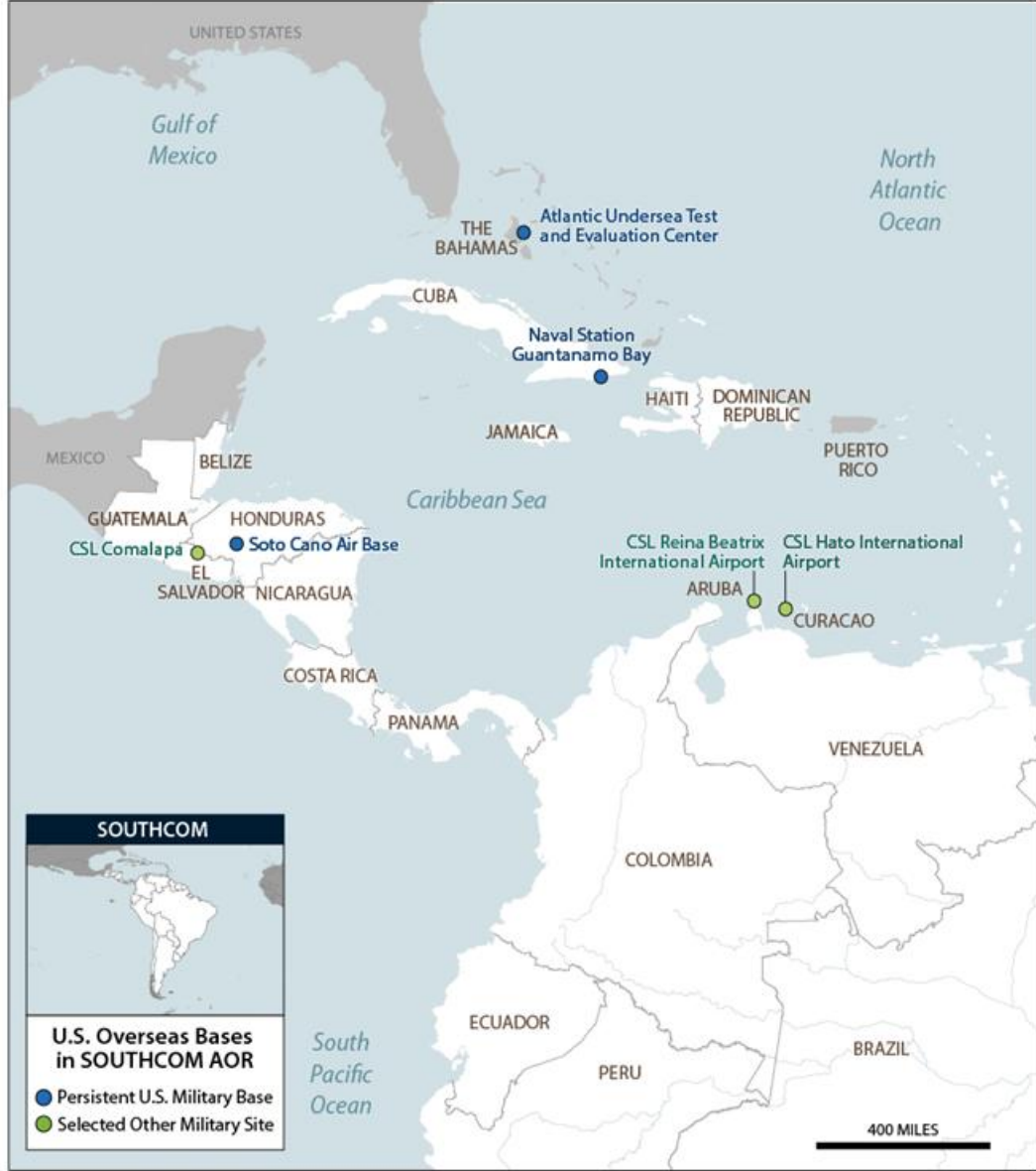
Figure 6. U.S. Overseas Bases in Central/South America and the Caribbean