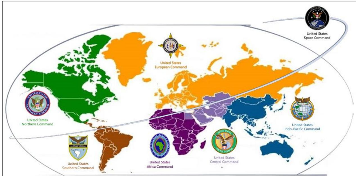
Figure 1. Geographic COCOMs