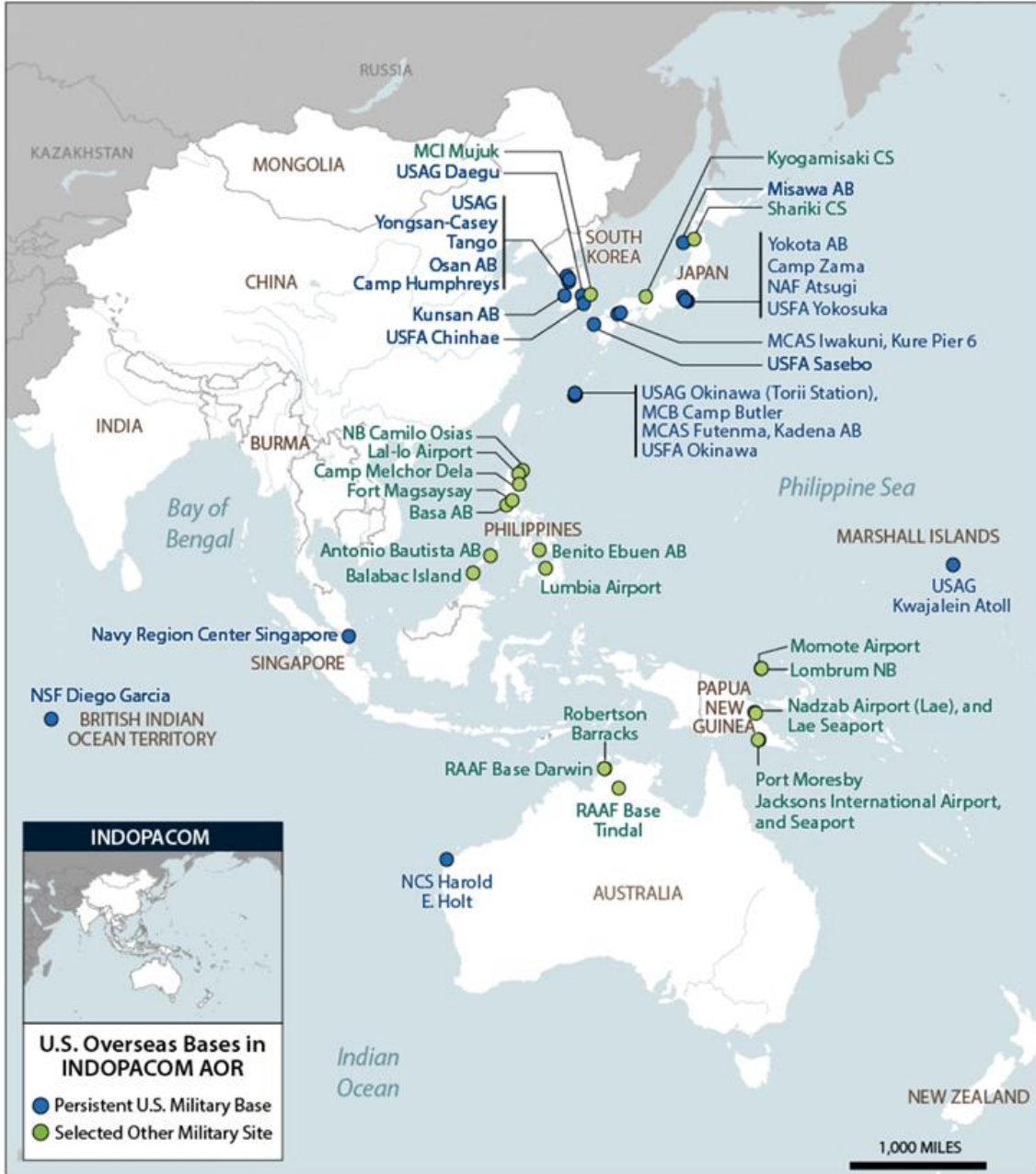
Figure 2. U.S. Overseas Bases in the Indo-Pacific